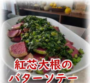
紅芯大根の バターソテー