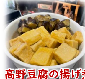
高野豆腐の揚げ煮