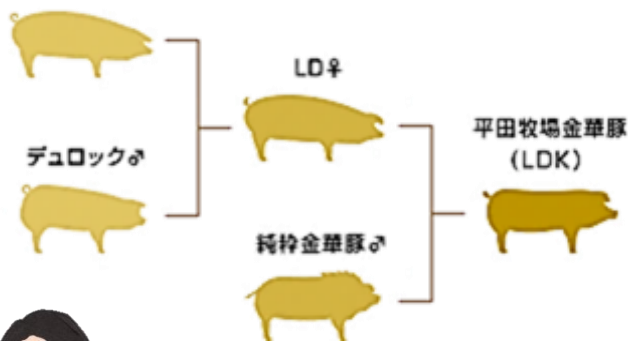
ランドレース♀ <平田牧場金華豚交配図>

国内の一般的な豚と比べると身体が二回り程小さく、その出荷体重は60~70kg。中型品種と言われる「黒豚」よりもさらに小さい豚です。つまり、飼育時間とコストは多くかかるけれど肉量は少ししか取れない豚なのです。しかしながら、その極上の肉質は食のプロからも高い評価を得ています。